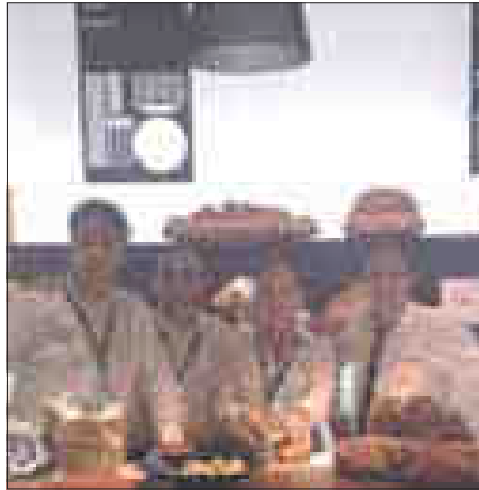
I panificatori materani

IL PANE di Matera in vetrina nella quarta edizione del Taste di Firenze. Il consorzio per la Tutela del Pane di Matera Igp è stato protagonista in positivo della tre giorni di assaggi, scoperte ed acquisiti nella rassegna denominata "Taste. In viaggio con le diversità del gusto", organizzata da Pitti Immagine e dal Centro di Firenze per la Moda Italiana. Da un'idea del "Gastronauta" Davide Paolini, infatti, è nata questa esposizione raffinata e ricercata dei migliori prodotti italiani, che viene riproposta per la quarta edizione alla Stazione Leopolda di Firenze e alla quale, per la prima volta, hanno preso parte i panificatori del Consorzio materano. Quattro giovani panificatori della città dei Sassi, infatti, sono riusciti ad entrare a far parte integrante di un progetto di qualità assoluta e ricercata dei prodotti tipici della cucina italiana grazie all'Identificazione Geografica Protetta, che il Pane di Matera ha ottenuto solamente da pochi mesi. Questa partecipazione è il primo effetto della creazione del Consorzio per la Tutela del Pane di Matera e dell'assegnazione dell'Igp, grazie al quale lo stesso consorzio è riuscito ad ottenere il pass per la manifestazione fiorentina. Probabilmente alla produzione materana serviva la spinta adeguata della terza generazione di panificatori per poter esplodere. «La terza generazione - ci spiega Massimo Ci-